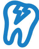
Zahnerhaltung und Endodontie